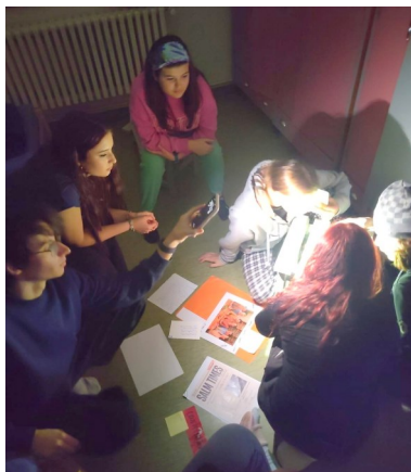
Escape game : un crime a eu lieu à Salm. Qui est la coupable ?

Juste avant halloween, on a imaginé une histoire hantée de la maison. Tout est vrai alors pourquoi ne pas croire que l'esprit de nos anciens est toujours là ? ».